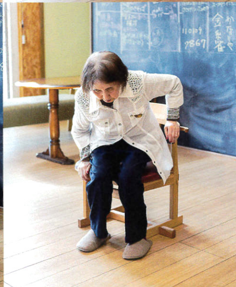
上:椅子への立ち座り 下:横座りなどの方向転換